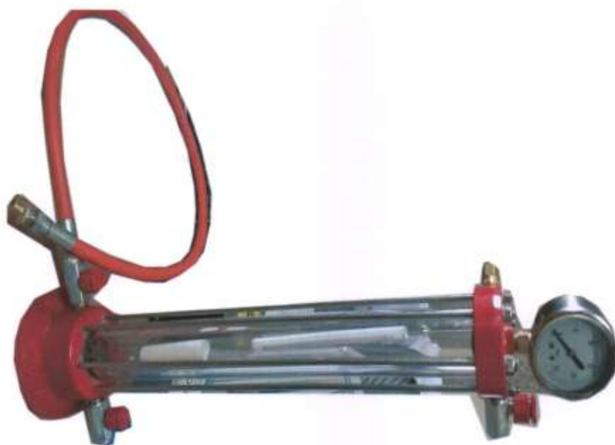
Шингүүсэн шугаан-хийн дөлсөөгч