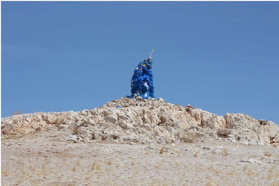
ХАН ДЭЭЖ ХХК ТОВЧ Танилцуулга

“Хан Дээж ХХК” нь 1997 онд Уул уурхайн ашиглалт, үйлдвэрлэлийн чиглэлээр дотоодын хөрөнгө оруулалттайгаар үүсгэн байгуулагдсан. 2014 оноос эхлэн гумин