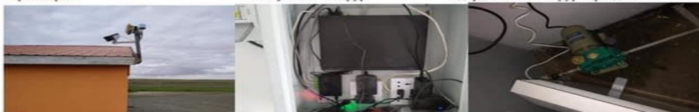
Хяналтын камер гадна, Гадна гэрэлтүүлэг