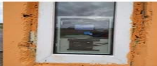
Вакум цонх шинээр суурилуулав.