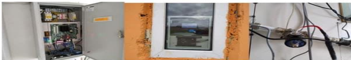
Автохудаг3.0 сервер болон Terminal цэсгэй

Дундговь аймгийн Сайхан-Овоо сумын төвийн Ундны усны энгийн уурхайн худагт смарт төхөөрөмж суурилуулах ажлын хүрээнд суурилуулагдсан төхөөрөмжийн зураг