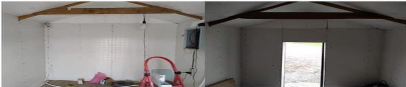
Худгын барилгын 10 хоосоор хана, таацыг дулаалан, хавтан барьж ирүлдэв.