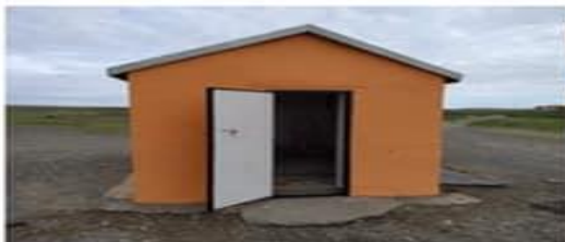
Худагт шинээр хаалга хийв,