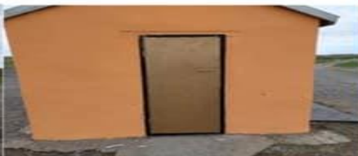
Ус авах талбай цутгав.