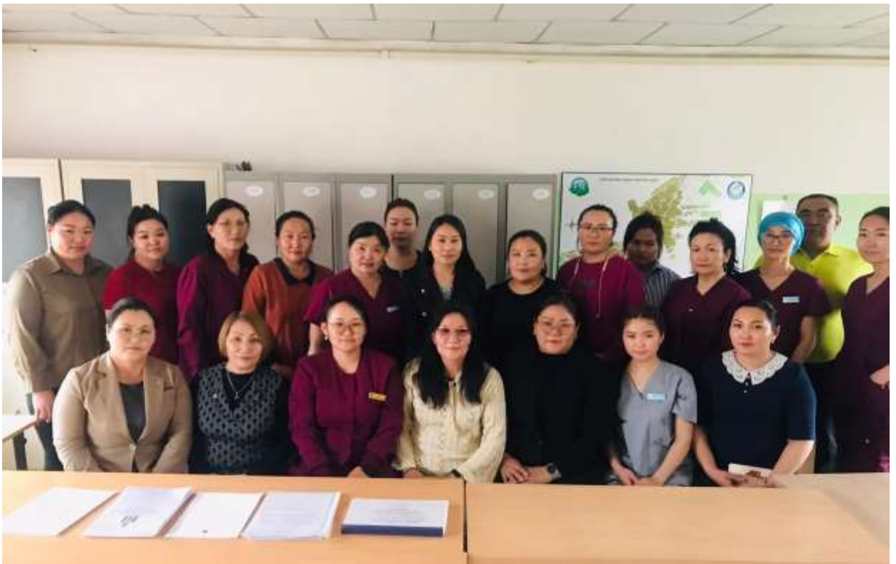
Аймаг, сумын ХАБЭА-н зөвлөлийн гишүүд

2022 оны “Эрүүл аюулгүй ажлын байрыг эрхэмлэгч байгууллага”-аар шалгарсан “Өлзийт мандал” өрхийн эмнэлгийн туршлагыг зөвлөлийн гишүүд, эрүүл мэндийн төвийн ажилчдаас бүрдсэн 10 хүний бүрэлдэхүүнтэй судалсан. Мөн энэ үеэрээ тусгай хөтөлбөрийн дагуу аймгийн ХАБЭА-н зөвлөлтэй хамтран хэлэлцүүлэг зохион байгуулж, сургалт авсан. Үүний үр дүнд зөвлөлийн гишүүн бүр сум, байгууллагадаа хийх ажил, судлах дүрэм, журмын жагсаалт гарган, төлөвлөгөөндөө тусган хэрэгжилтийг хангасан. Уг арга хэмжээ зохион байгуулахад сумын Засаг даргаас 170,0 мян төгрөгний дэмжлэг үзүүлж, байгууллагуудын ХАБЭА-н зөвлөл бензиний зардал гарган дэмжсэн.