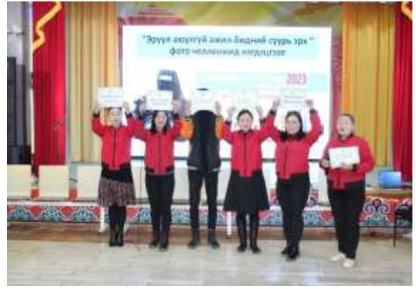
Фото чөлөөжид нэгдэх арга хэмжээ

Байгууллагуудын ХАБЭА-н зөвлөл бүгд сарын аяны хүрээнд хийх ажлын төлөвлөгөө гарган, гүйцэтгэсэн ажлын тайлангаа хугацаанд нь ирүүлсэн.