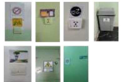
Бүх байгууллага эмийн сан, термометрийг байгууллагадаа байршуулсан.