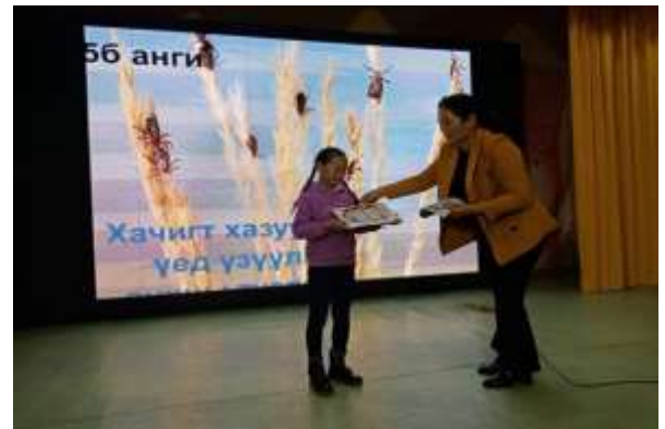
Оролцсон хүүхдүүдэд “Талархал” хадгалуулсан.

Энэ сарын аянаар бүх байгууллага самбараа шинэчлэх, тэмдэг тэмдэглэгээ хийх, галын схем, галын хор байрлуулах зэрэг ажлыг сайн хийж гүйцэтгэсэн.